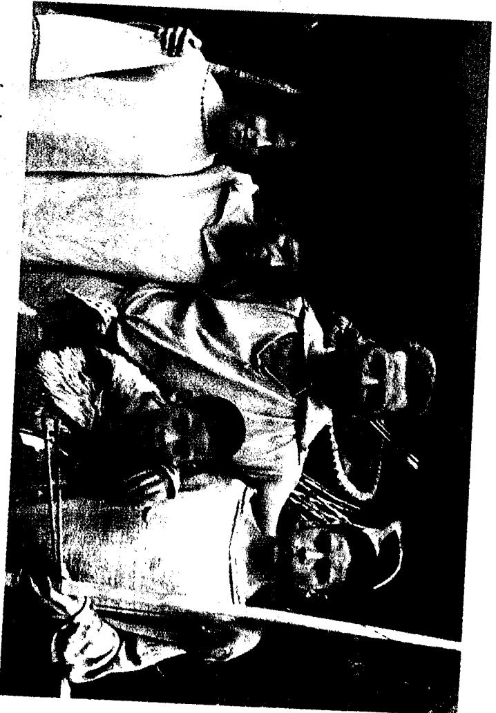
Le documentaire qui sera projeté demain soir, en avant-première, au cinéma de Riom-ès-Montagnes, retrace une expérience scientifique portant sur la vie au néolithique réalisée l'été dernier à Collandres.