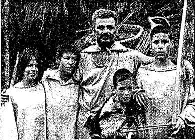
Sympa, la famille Cro-Magnon.