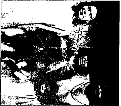
Photo de famille « néo »-néolithique devant une hutte « F4 » de brondes et de torchis.