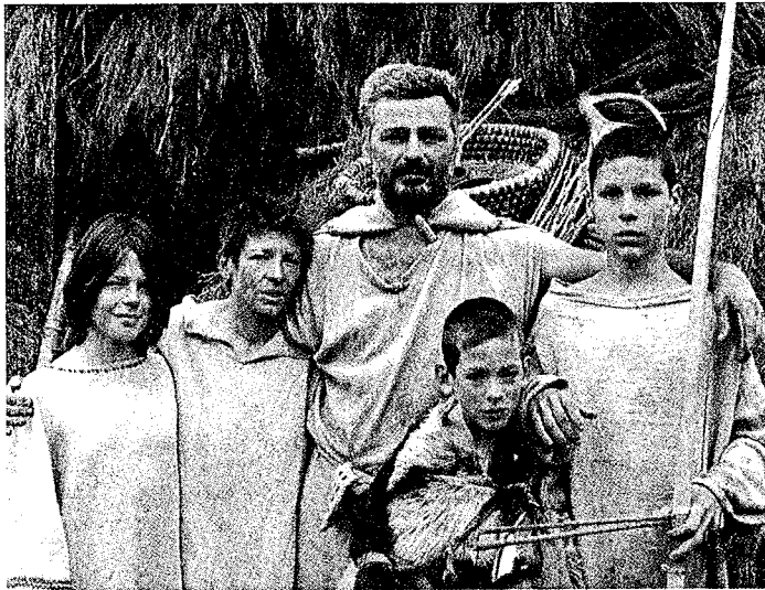
LA COMPAGNIE DES TANG-BROUSSE