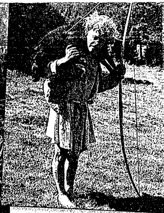
Un spécialiste a initié les candidats à la chasse.

Explore nous fait faire un bond en arrière de cinq mille ans